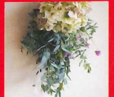
グリーンをメインに新緑のイメージのミニスワッグ作り