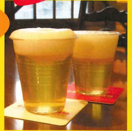
場所/カフェブリック 料金/1個200円