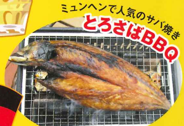
場所/マルシェ広場 料金/1尾500円