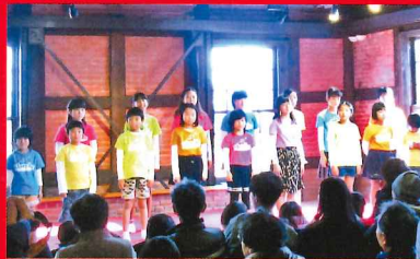
子どもコーラスマルシュ