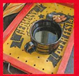
カフェトレイ作り