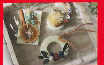
キャンドルワークショップ