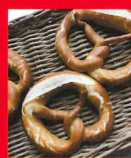
プレッツェルを作ってみよう