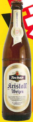
トゥーハークリスタル・ヴァイツェン