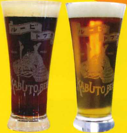
復刻明治カプトビール 復刻大正カプトビール