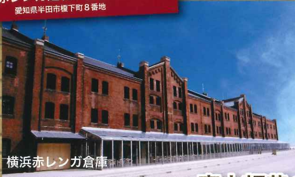
横浜赤レンガ倉庫

ビール好きが講じ「ビアホール」という言葉を作ったと言われる 明治建築界の巨匠・妻木頼黄の人生、作品をたどる。