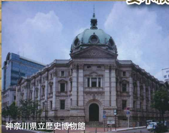
神奈川県立歴史博物館