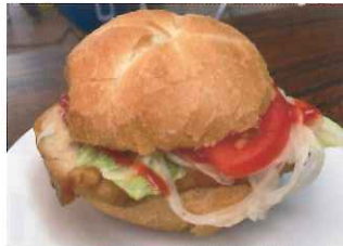
●赤レンガドイツバーガー 500円