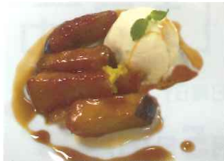
●お芋スイーツ コーヒーまたは紅茶付 500円